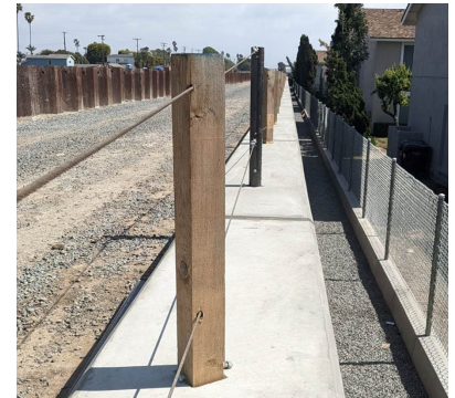
Mejoras viales, tope de hormigón, BMP de drenaje lateral y cercado de derecho de paso.