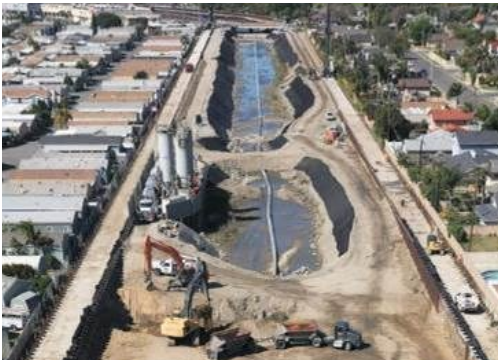
Los silos para cemento que se muestran aquí (lado izquierdo del canal) se retirarán para junio de 2022.

Esté atento a nuestros equipos de construcción que trabajan en la mezcla de cemento en lo profundo del suelo, la excavación del talud del canal, el tope de hormigón y las mejores prácticas de gestión (Best Management Practices, BMP) de drenaje.