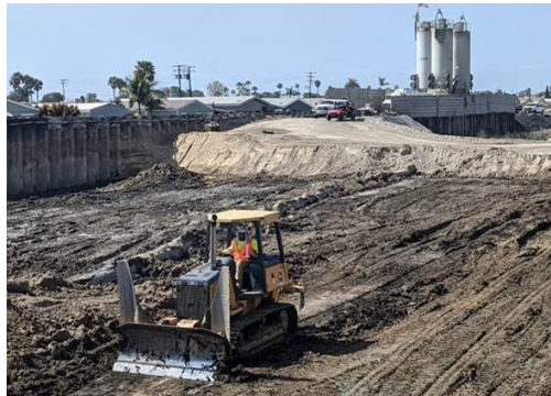
Excavación en curso de cuña de suelo del canal.